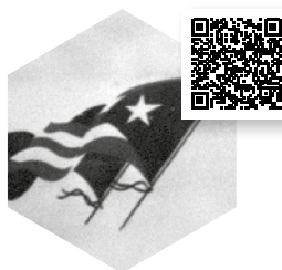
Federici, Silvia. El patriarcat del salari . Manresa: Tigre de paper, 2018.

Llegir Federici. Per què Marx feu una anàlisi indispensable per entendre el funcionament del sistema capitalista, però oblidà les dones i per això cal repensar-lo des del feminisme. I sí, espanta pensar que potser, com diu Federici, cada moment de la nostra vida ha servit per a l'acumulació de capital. Però és després de l'espant que comença la lluita. ●